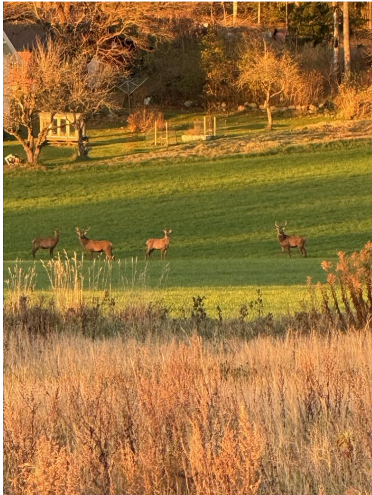
Hjort observert i Rygge (Rådeskogen).

Råde: Forskrift om adgang til jakt etter elg og rådyr, Råde kommune, Østfold - Lovdata